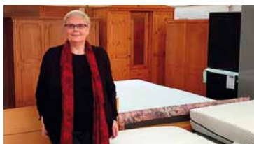
Wohnbedarf für Familien und ältere Menschen