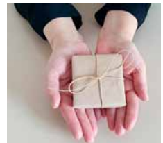
Spenden statt Geschenke