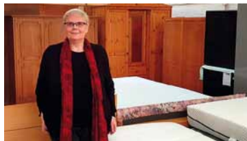
Wohnbedarf für Familien und ältere Menschen