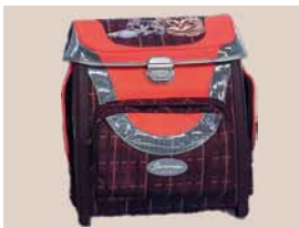
Schulausstattung für Kinder